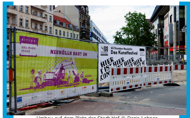
Umbau auf dem Platz der Stadt Hof

mit temporären Verkaufsräumen, Fashionweekends und Designercastings immer wieder für „Hingucker“ auch für neues, internationales Publikum in Nord-Neukölln gesorgt. Der Handelsnewsletter hat sich zu einem wichtigen Medium für die Darstellung der Händler entwickelt. In einer Standortbroschüre wurden die Stärken und Schwächen sowie Investitionen und Entwicklungspotenziale des Geschäftszentrums aufgezeigt. Mit dieser wird offensiv und ehrlich bei