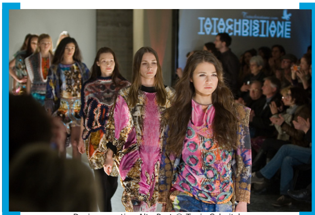
Designercasting Alte Post