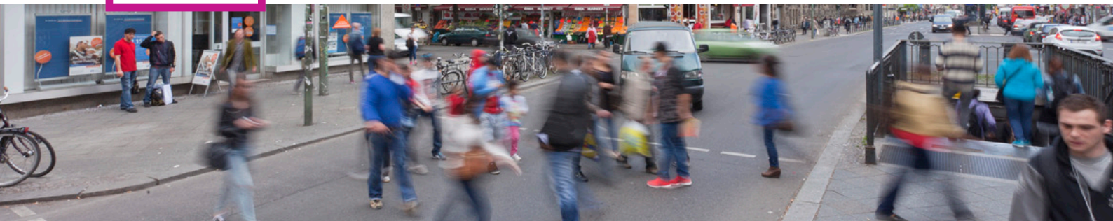
Buntes Treiben auf der Karl-Marx-StraÙe