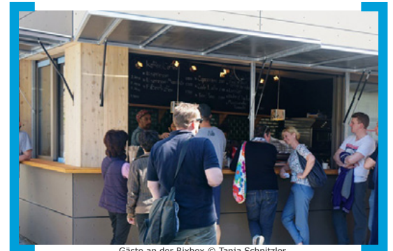
Gäste an der Rixbox

—> www.facebook.com/pages/Rixbox-Espresso-Food/399221523538152