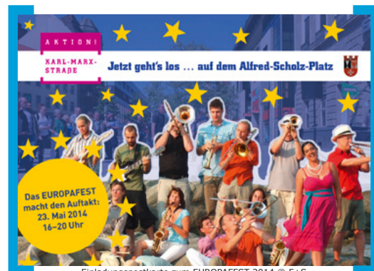
Einladungskarte zum EUROPAFEST 2014

Zeit: 23. Mai 2014 zwischen 16.00 und 20.00 Uhr; Eintritt frei → www.aktion-kms.de