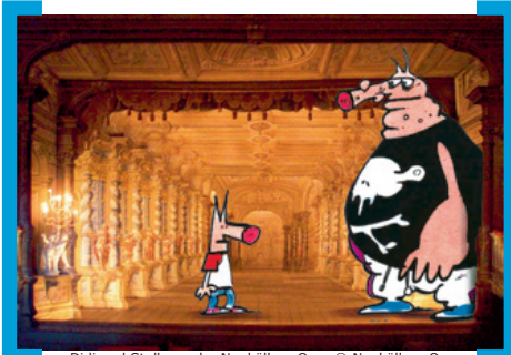
Didi und Stulle an der Neuköllner Oper