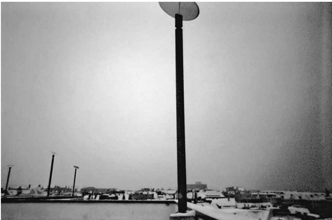
Beniamin, 10 Jahre