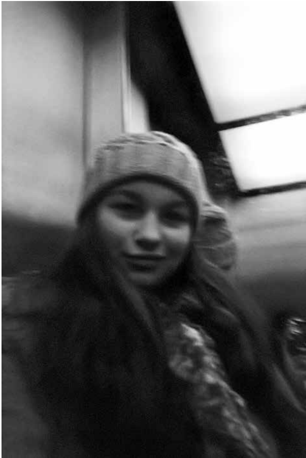
Florina, 12 Jahre