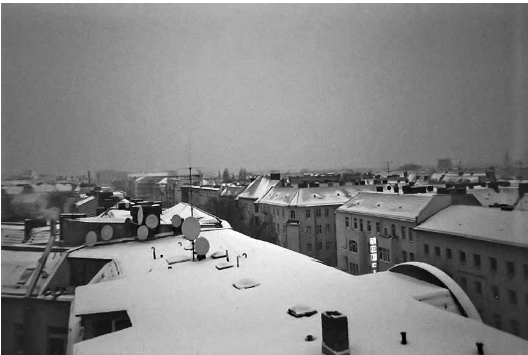
Sefora, 13 Jahre

Gefördert wurde das Projekt mit 1000 Euro aus dem Quartiersfonds 1.